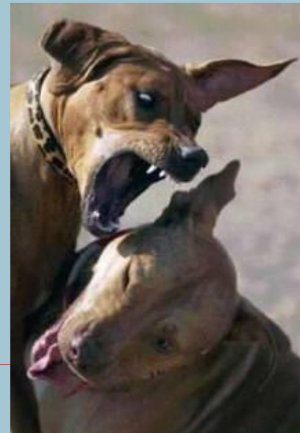
th Ágnes - SEK